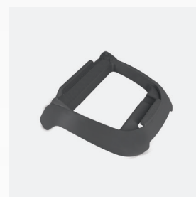
Base para caixa de controlo