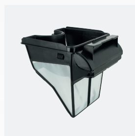
Caixa filtrante Filtro simples 100 µ