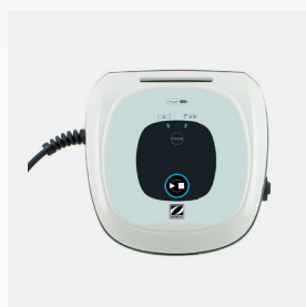
Caixa de comando